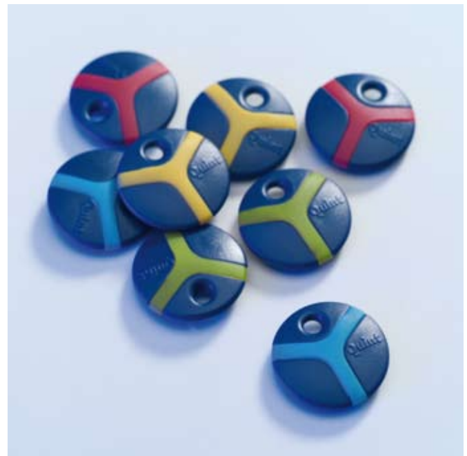
QuintChips mit bunten Silikon-Überzügen

Stecken Sie dazu einfach den Chip in den Programmierspalt des QuintChip -Geräts, wählen Sie das gewünschte Anwendungsprogramm am Computer und drücken Sie die Start-Taste. Die Prägung dauert nur eine Minute, das Gerät schaltet danach automatisch ab.