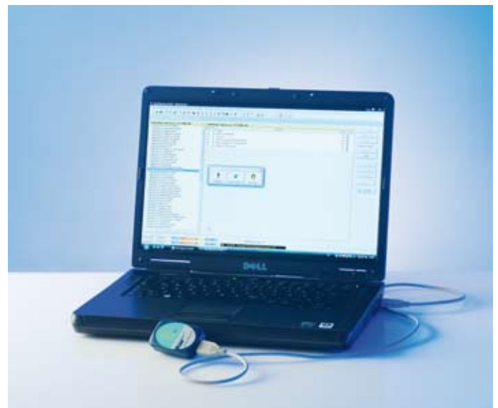
QuintBox-T mit QuintSpectrum

gewünschte Anwendungsprogramm als andauernde Optimierungsinformation an den Körper ab