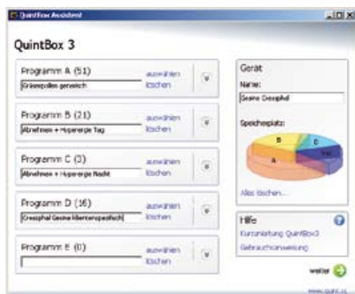
Software-Assistent zur QuintBox-Programmierung